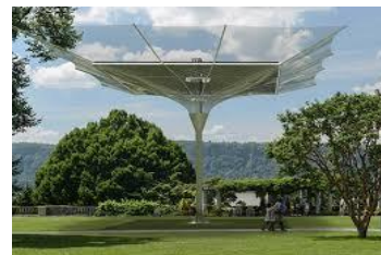
Water Sun Canopy